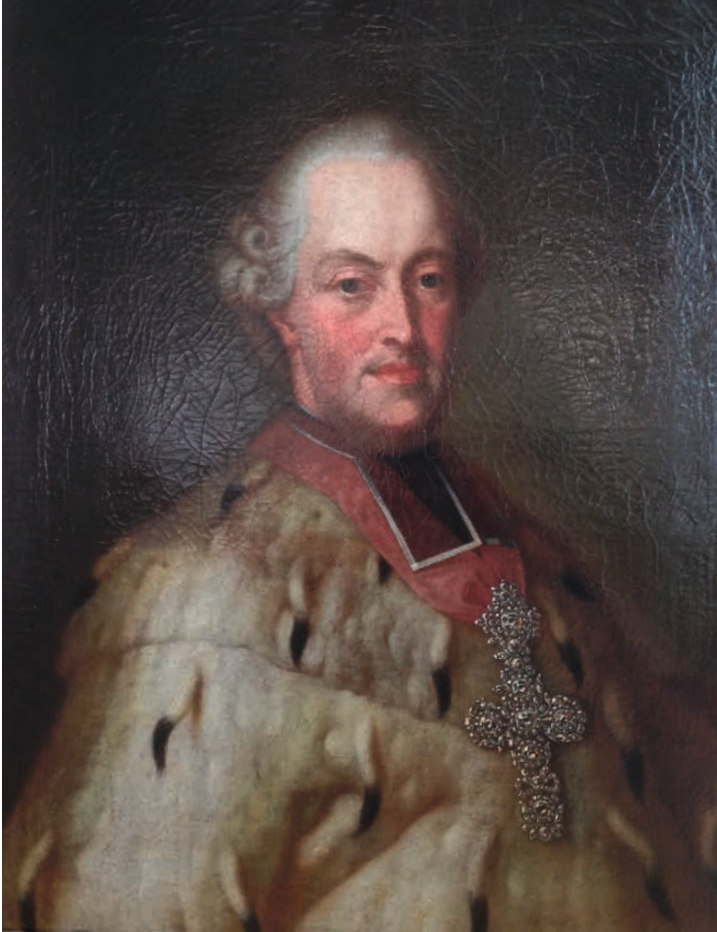
Clemens Wenzeslaus von Sachsen (1739–1812), Kurfürst und Erzbischof von Trier 1768–1802, Ölporträt von dem Kurfürstlichen Hofmaler Heinrich Foelix (1732–1803)